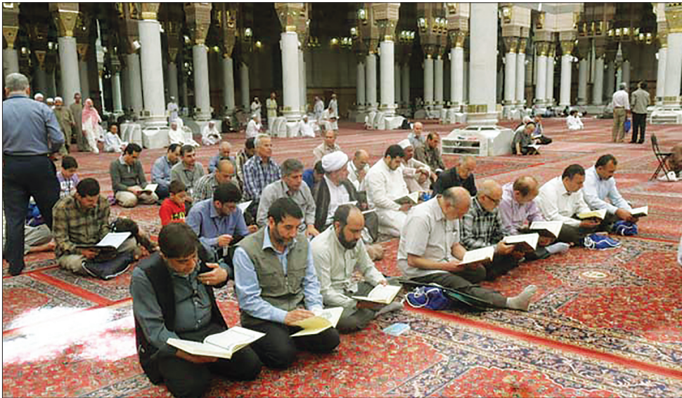
سرپرست حجاج ایرانی با تاکید بر توجه به رهنمود مقام معظم رهبری بیان کرد: